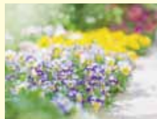
かだんかんり 花壇管理