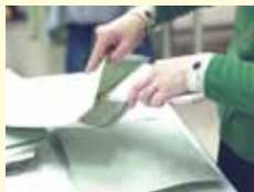
ふうにゆうふう 封入・封かん