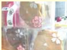
やきがしせいぞう 焼菓子製造