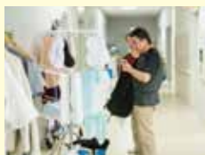
せんたく ユニフォーム洗濯