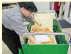
しゅつちようはんばいかいじゆんび 出張販売会準備