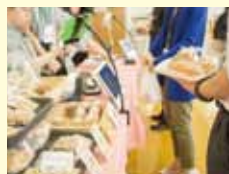
しゅつちようはんばいかい 出張販売会