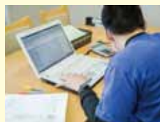
じししゅう パソコン実習