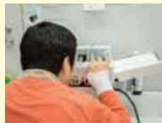
めいししんさつ 名刺印刷